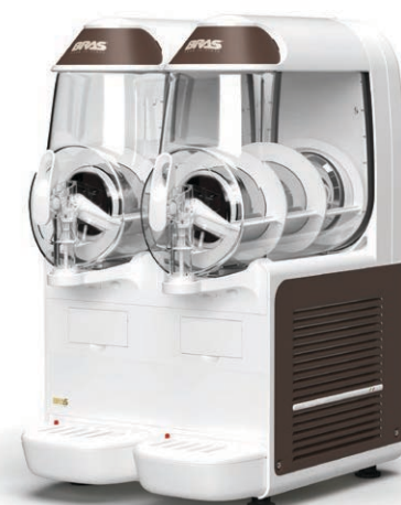
B-frozen Smart 10.2