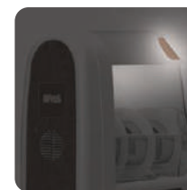
immagine sopra vasca retroilluminata backlit image above the tank image rétro-éclairée au-dessus du réservoir Hintergrundbeleuchtetes Bild über dem Tank imagen retroiluminada sobre el tanque