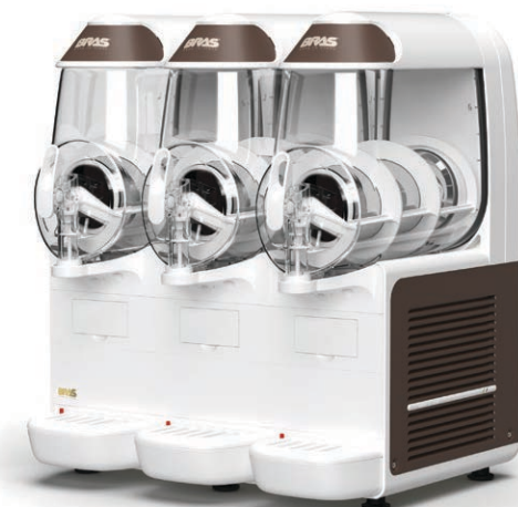
B-frozen Smart 10.3