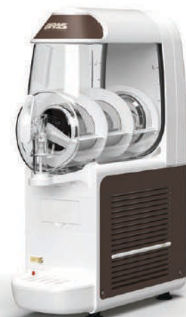
B-frozen Smart 10.1