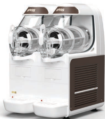
B-frozen Smart 6.2