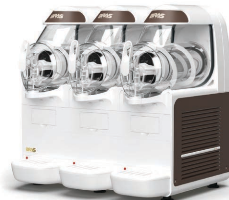
B-frozen Smart 6.3