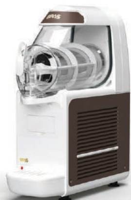
B-frozen Smart 6.1