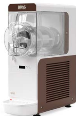
B-cube 6.1 ETC