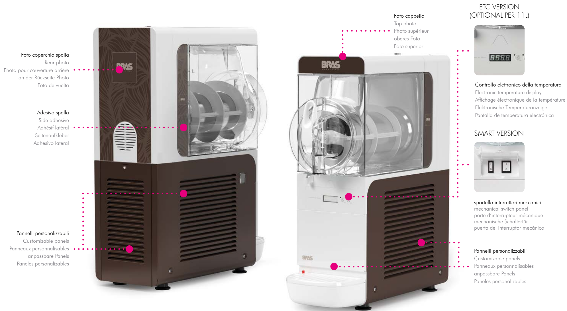
Foto coperchio spalla

Rear photo Photo pour couverture arrière an der Rückseite Photo Foto de vuelta